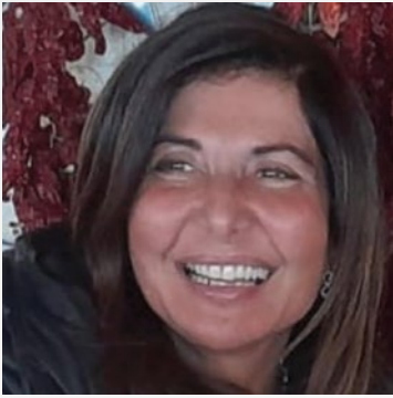
Simona Loizzo Deputato della Repubblica