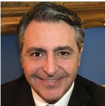
Fabio Gallo Fondazione Paolo di Tarso