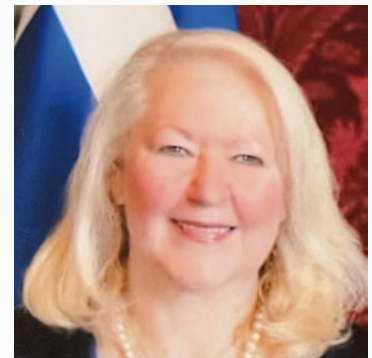
S.E. Eleni Sourani Ambasciatore di Grecia in Italia