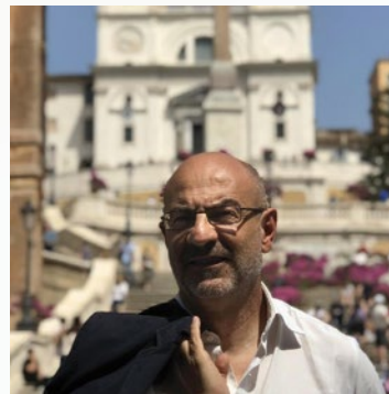
Franco Bruno Associazione Culturale Neomedi