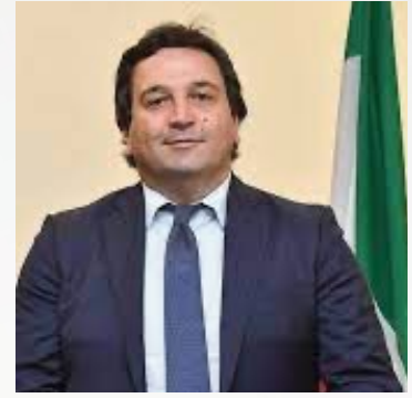
Fausto Orsomarso Senatore della Repubblica